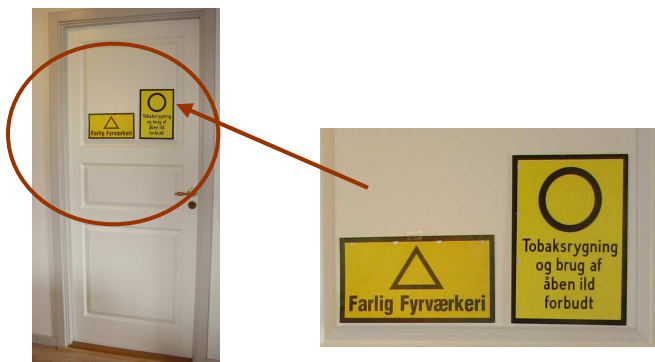
Lukket dør til oplagsrum med skiltning om "farlig fyrværkeri".

På den udvendige side af dørene til opbevaringssted i bygninger og containere skal der opsættes sikkerhedsskilte med teksten "FARLIGT FYRVÆRKERI".