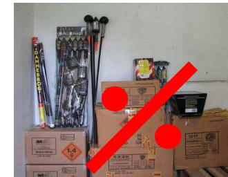
Forkert opbevaring af fyrværkeri, alle fyrværkeri artikler skal være placeret i godkendte transportkasser.

Containere og opbevaringsrum skal holdes aflukkede, når der ikke indsættes eller udtages varer. Ethvert oplag af fyrværkeri og andre pyrotekniske artikler skal forsvarligt sikres mod tyveri. Yderdøre i bygninger og containerdøre skal holdes aflåst, når der ikke indsættes eller udtages varer.