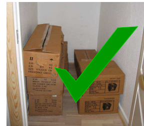
Rigtig opbevaring af fyrværkeri, kasserne er lukkede.

Fyrværkeriet skal opbevares i lukkede kasser. Der må kun åbnes én kasse med hver artikel ad gangen. Efter man har taget en artikel op af kassen, skal lågene på kassen lukkes ned igen, så fyrværkeriet er beskyttet mod gnister, hvis der skulle opstå brand i nærliggende effekter.